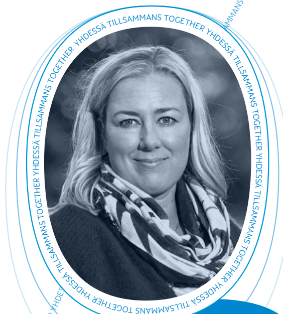
JUTTA URPILAINEN Kirjoittaja on EU:n kansainvälisistä kumppanuuksista vastaava komissaari.

Kestävän kehityksen tavoite neljä on nimeltään ”hyvä koulutus”. Kestävä kehitys on kokonaisuus, joten tavoitteita