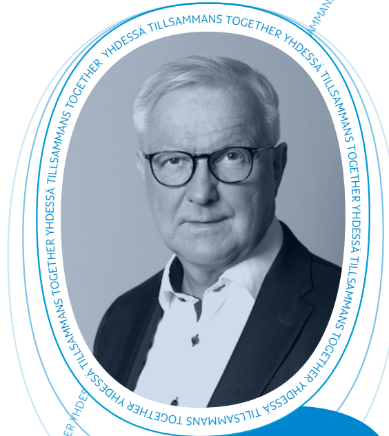
OLLI REHN Kirjoittaja on Suomen Pankin pääjohtaja.

Julkisen talouden tilanne on kuitenkin heikentynyt ja Suomi velkaantunut jo pitkään ennen pandemiaa. Suomen julkinen velkasuhde on kasvanut lähes yhtäjaksoisesti jo 15 vuoden ajan. Ruotsin ja Tanskan julkinen velkasuhde on py-